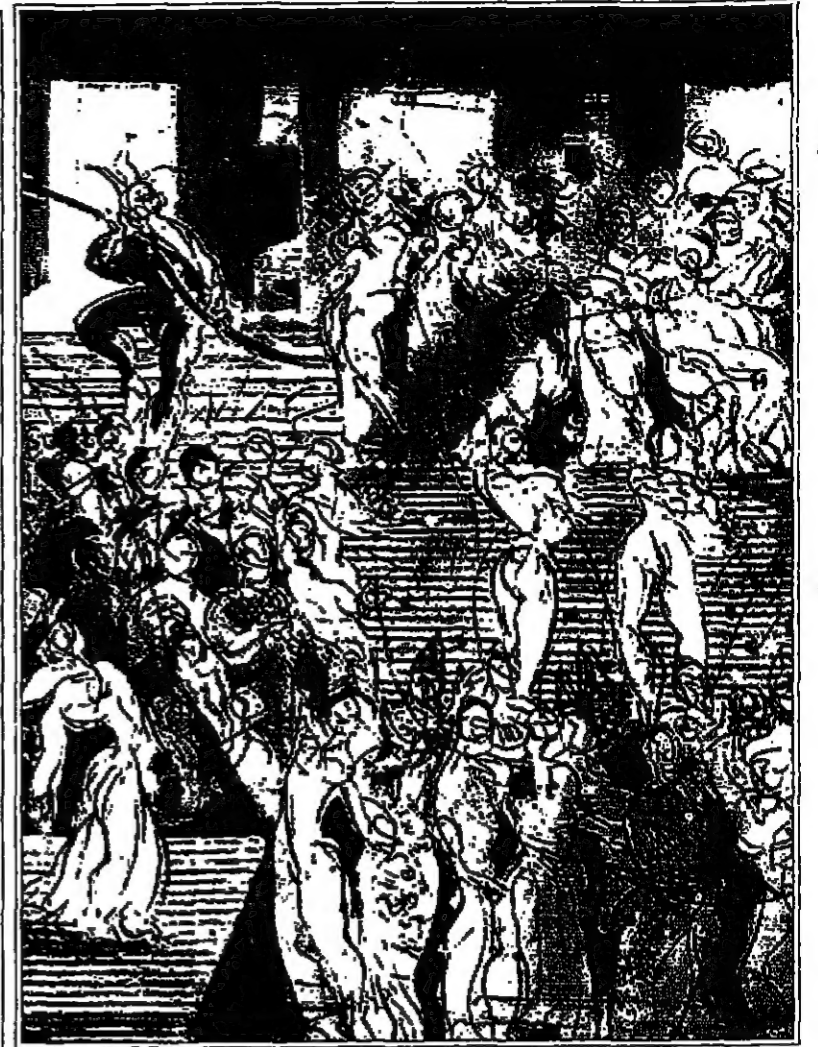
من أعمال العرض